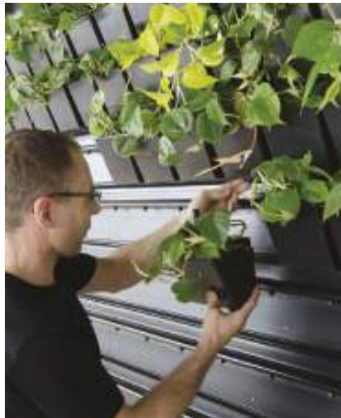
Die Natural Greenwalls® Pflanzentöpfe werden in die Schienen eingeklickt.