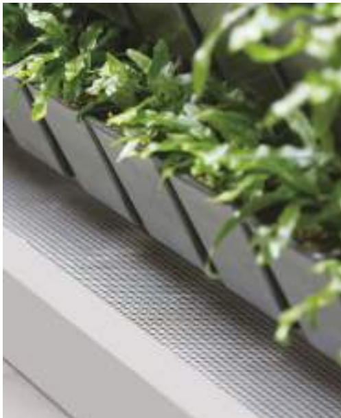
Die ausgewählten Pflanzen werden bereits in den Natural Greenwalls® Pflanzentöpfe an Sie geliefert.