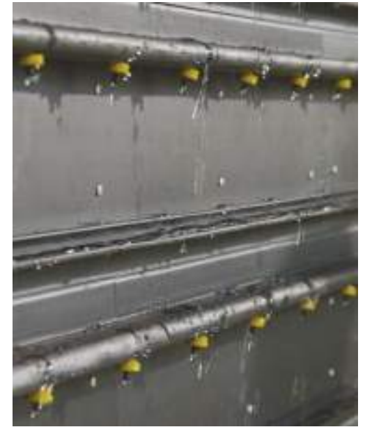
Tropfbewässerungssystem wird getestet.