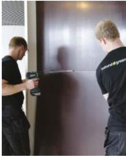
Aufbau der Unterkonstruktion in Form von Wasserbeständigen Platten.