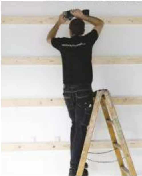
Wir installieren eine Verschalung zur Befestigung der Unterkonstruktion.