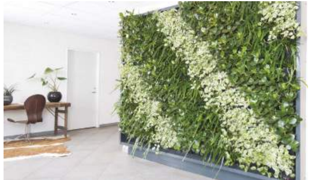
Der Aufbau der fertigen Natural Greenwalls® Pflanzenwand wird mit einem graulackierten Aluminiumrahmen abgeschlossen.