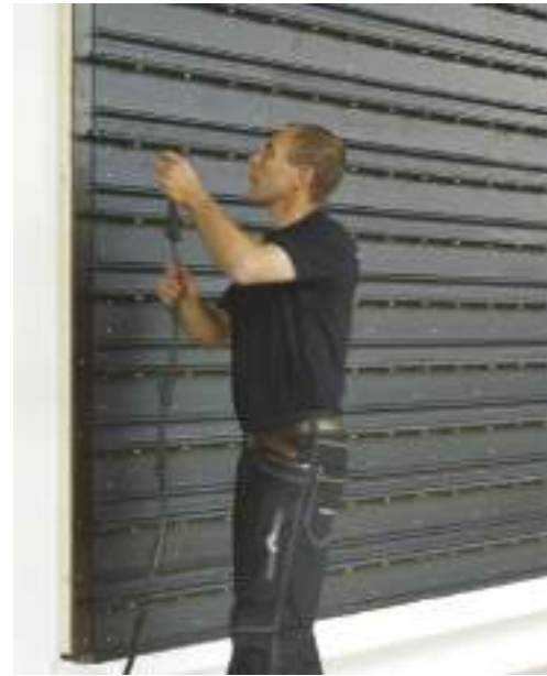
Natural Greenwalls® Schienen werden montiert, Tropfrohre eingesetzt und die Installation abgeschlossen.